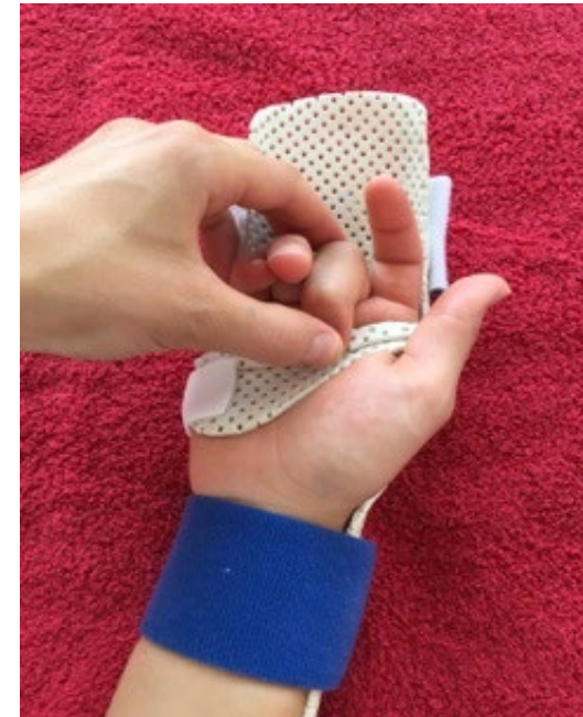
Abb3 passive Flexion